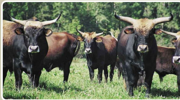
Heckrinder-Herde am „Infohaus Isarmündung“

Aus Asien verschwanden die Urstiere bereits in frühgeschichtlicher Zeit. In Ägypten sind sie auf Jagdbildern des alten Reiches zu sehen. Caesar kannte die Ure nur noch aus den Wäldern des nördlichen Europa. Er schildert sie als etwas kleiner als die Elefanten. Sie seien sehr stark und behende und hätten weder Mensch noch Tier geschont. Die Germanen benutzten die Hörner der Ure „bei prunkvollen Gastmählern als Trinkgefäße“.