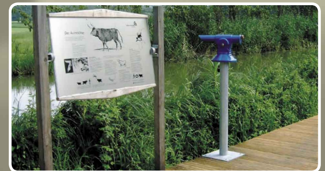
Beobachtungsplattform mit Informationsschild und Fernrohr

Die Heckrinder, die Sie von der Beobachtungsplattform des „Infohauses Isarmündung“ sehen, sind Wildrinder, die auf die oben beschriebenen Rückzuchtungsversuche der Gebrüder Heck zurückgehen.